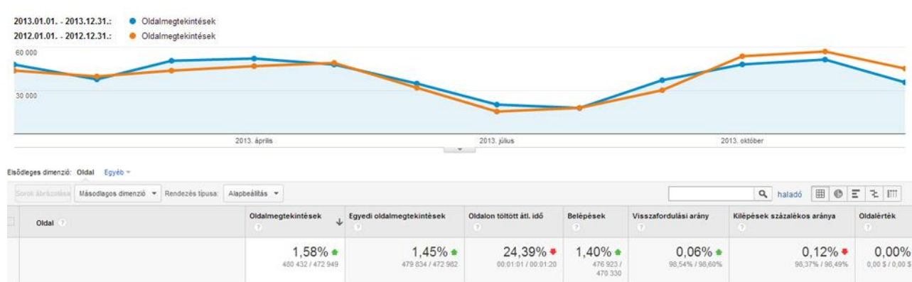
A Gyógypedagógiai Szemle Online havi olvasottsága 2012-ben (narancssárga) és 2013-ben (kék).

** Nincs pontos adat más statisztikai analízis technika miatt, becslés (SNI petícióval együtt): kb. 60 ezer / év